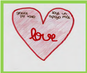
Nuestros Niños — Pg. 14