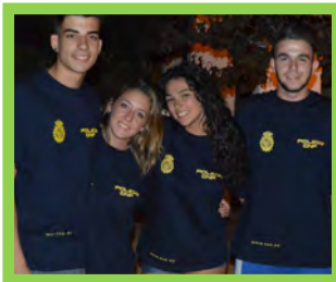
Su Realidad — Pg. 20