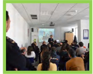
Acercándonos —Pg. 10