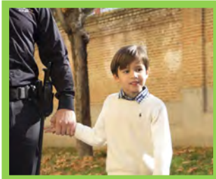
Apoyo Económico —Pg. 12