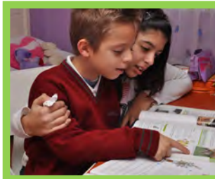
Programas — Pg. 16