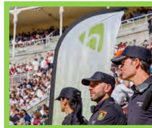
¡Gracias a ti! — Pg. 24