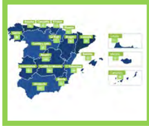
Beneficiarios — Pg. 6