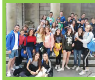
Apoyo Asistencial — Pg. 8