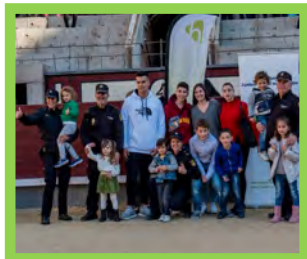
Los Mejores Resultados — Pg. 22