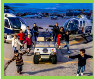
Misión y Visión — Pg. 4