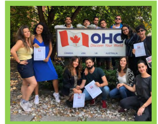
Programas — Pg. 18