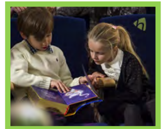
Nuestras Cuentas — Pg. 26